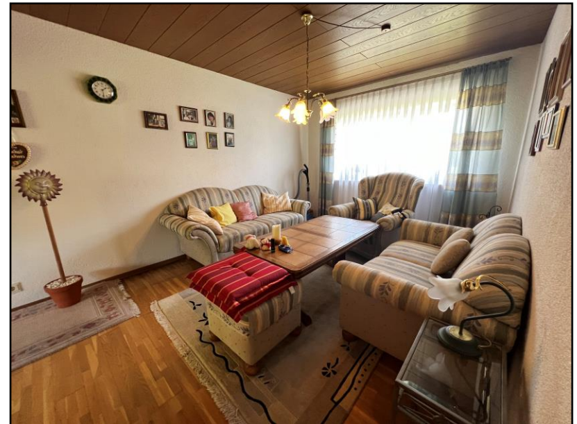
Erdgeschoss – Wohnzimmer u. Küche