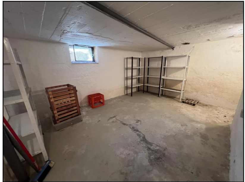
Erdgeschoss: Bad u. Flur – UG Keller